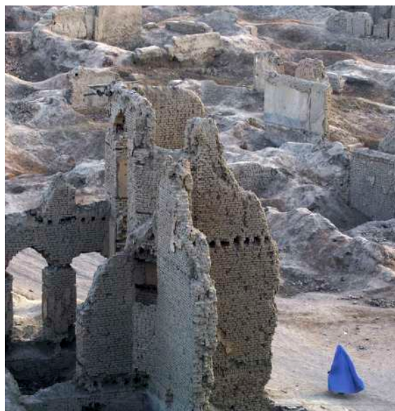
L'avenue Jodi Mayuan, à Kaboul, totalement détruite lors de la guerre civile qui sévit entre 1992 et 1996.