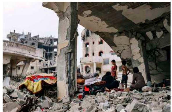
Gaza, 2024 © Fatma Hassona

Les civils, femmes, enfants, vieillards, incarnent l'innocence frappée par la guerre et deviennent les symboles d'un combat qui s'immisce dans l'intimité du quotidien. Ces représentations, déjà très présentes en 1914-18 ou lors du Blitz de Londres en 1940, constituent parfois des images de propagande visant à dénoncer les conséquences des attaques de l'ennemi sur les populations civiles.