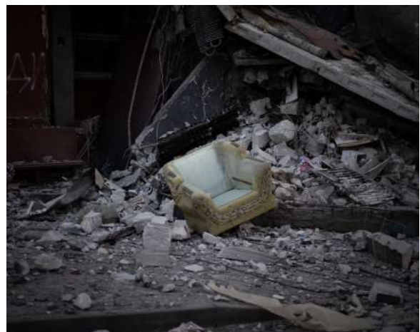
Un fauteuil dans les ruines d'un immeuble dans le quartier de Saltivka à Kharkiv - Ukraine, Avril 2022.