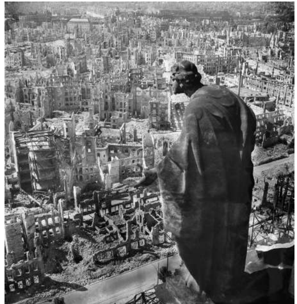
Vue sur la ville de Dresde avec la sculpture « Bonitas »

La ruine devient alors une preuve visuelle, celle d'une attaque, d'un bombardement, d'une barbarie attribuée à l'ennemi. Un siècle plus tard, ce rôle probatoire demeure, comme en témoignent les images des destructions en Syrie ou en Ukraine régulièrement mobilisées dans les médias et les instances internationales.