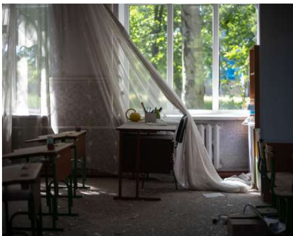
Dans une école bombardée à Osokorivka, Ukraine, Mai 2022.

Il ne faut surtout pas qu'il y en ait. Les rédactions imposent des coupures obligatoires pour éviter l'accoutumance. Sinon, on prend de plus en plus de risques, on se rapproche toujours davantage des bombes, et l'on devient de moins en moins humain mais davantage dans une logique de performance ou de "business". Cela se ressentirait dans les images. Il y aurait moins d'humanité dans la photographie. C'est pour cela que les pauses sont nécessaires. Il faut revenir en France, se reconnecter. La norme, ce n'est pas la guerre.