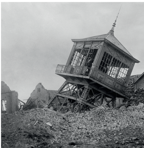
Mines de Meurchin, côté sud fosse n°5, 13 avril 1919. Extrait du reportage « Meurchin, les ruines des exploitations minières ».

À travers cette exposition, le Mémorial 14'18 Notre-Dame-de-Lorette poursuit sa mission : éduquer au regard, offrir une compréhension sensible et éclairée de l'image de guerre, et donner à voir comment la photographie, loin d'être un simple enregistrement, participe à la construction des récits des conflits.